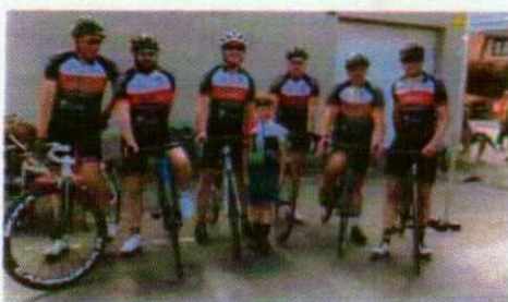
Quelques moments du lieu ville club.