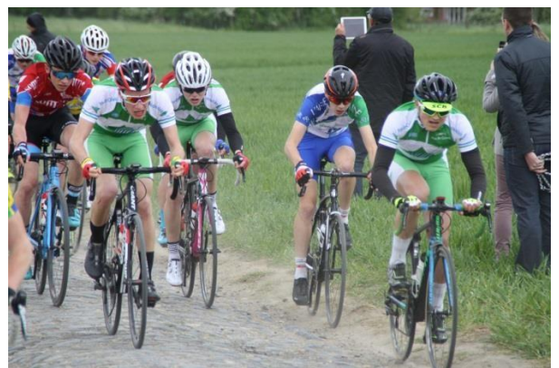
secteur pavé du moulin de vertain

SAINT QUENTIN EN YVELINES (78) le 27 mai: