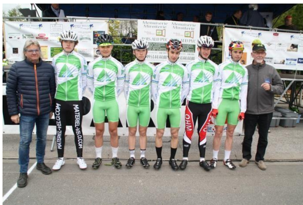
Présentation des équipes