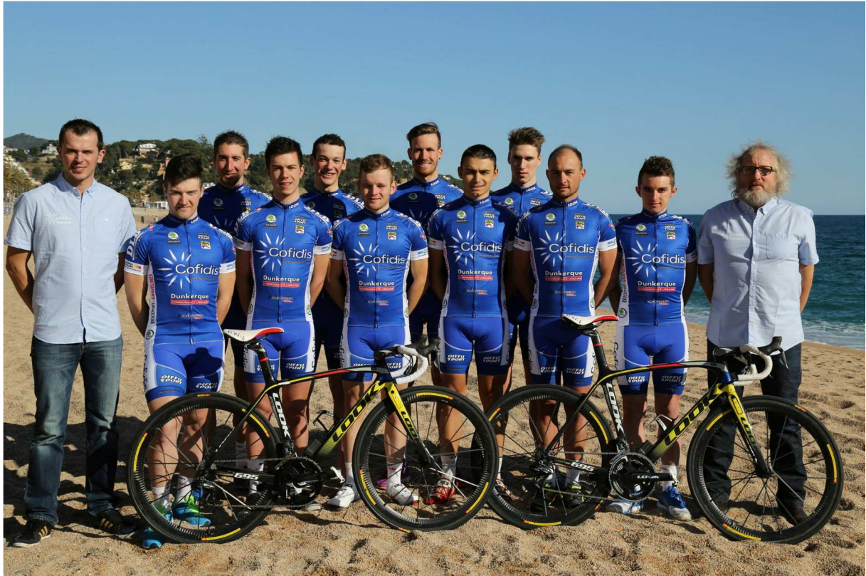
Groupe 2015 – Costa Brava Espagne